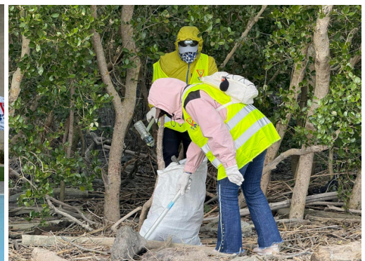
Uge 4 Affald: Strandrengøring ved Tai Chung-distriktet, Taiwan