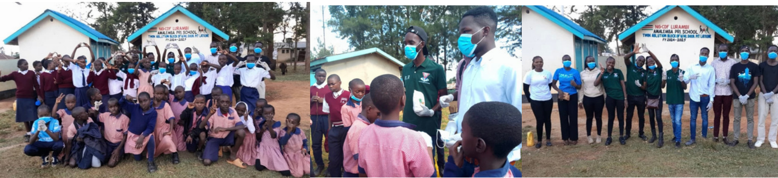
Y's Youth Service Club of Kakamega gennemførte en rengørings- og sanitetsøvelse på Amalemba Primary School, Kenya