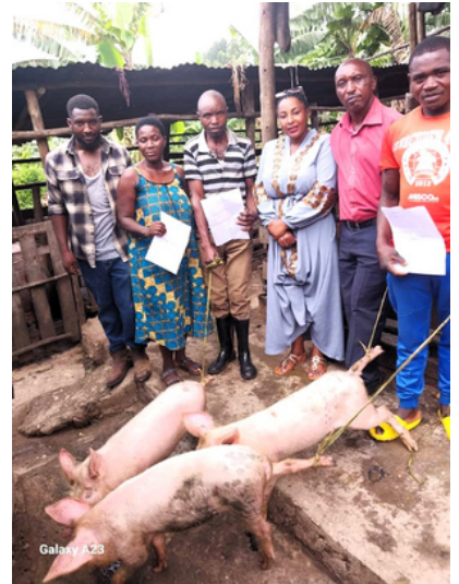
TOF 21-02 Rwanda

Fra projektets tidlige stadier har de deltagende landbrugere bidraget med 60% af driftsomkostningerne gennem arbejdskraft og landbrugsaktiviteter såsom fødevarerproduktion. Over tid vil denne procentdel falde, hvor salget af smågrise dækker 100 % af driftsomkostningerne, hvilket sikrer projektets bæredygtighed samtidig med at dets kerneværdi opretholdes.