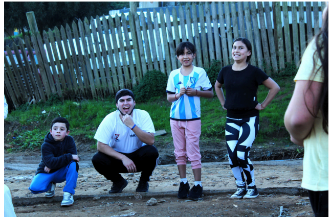
TOF 24-08 Chile

Genopretning af håb-projektet i Valparaiso, Chile, yder støtte til lokalsamfund, der blev ramt af skovbrandene i 2024. I den indledende fase etablerede projektet med succes et professionelt team, engagerede frivillige og organiserede rekreative og psykologiske støtteaktiviteter for børn, unge og ældre. Mere end 1.500 måltider blev uddelt, og der blev gennemført initiativer inden for mental sundhed i syv berørte samfund. På trods af udfordringer med deltagerengagement, koordinering og sikring af sikre aktivitetsrum, styrket partnerskab i lokalsamfundet, hjalp særlige opsøgende indsatser med at opretholde fremskridt. Fremadrettet vil projektet fortsætte med at yde mental sundhedsstøtte, udvide aktiviteter i skoler og levere vigtige forsyninger til berørte familier.