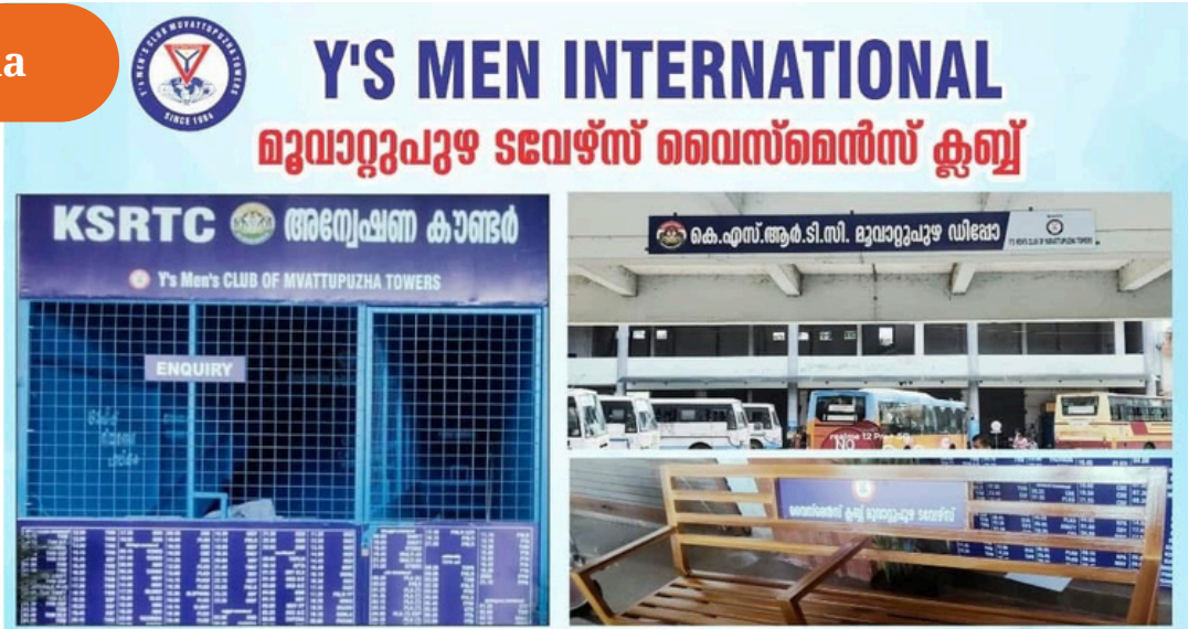
Y's Men's Club of Muvattupuzha Towers sponsorerede et businformationscenter og busventebænke ved KSRTC Bus Stand i Muvattupuzha.