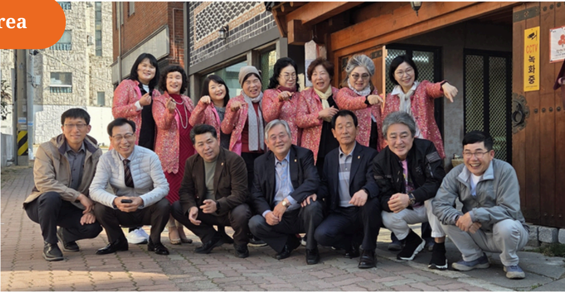
Fejring af enhed og fællesskab: IPRD'er i Korea-området samles i Jeonju IPRD'erne i Korea-området samledes i Jeonju den 21. marts 2025 for at fejre deres fælles rejse og varige fællesskab, som samler RD'erne i 2023/24 og deres ægtefæller for at styrke dybe venskaber og minder alle om, at de bånd, som dannes gennem tjeneste, strækker sig ud over en enkelt periode.

Y's Men International Rue de Lausanne 121 CH-1202 Geneva Switzerland www.ysmen.org