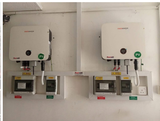
Et solenergisystem blev installeret i National YMCA-bygningen i Sri Lanka med støtte fra YMI's Carbon Offset Fund/Environmental Protection Fund.