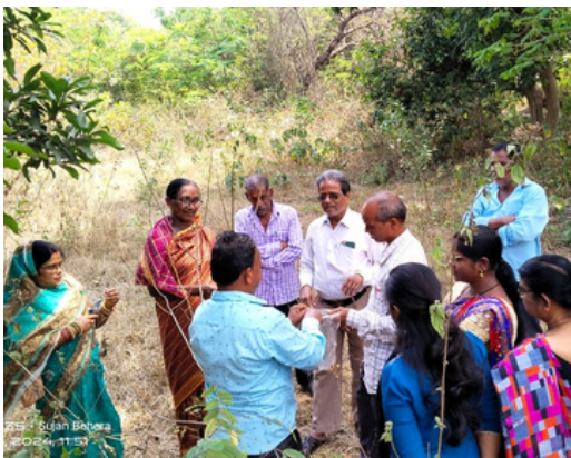
TOF 23-06 India

YMCA Landbrugsskole (YAS)-projektet i Indien blev udviklet for at udstyre 100 marginaliserede landmænd med viden og faglige færdigheder til at forbedre deres indtjeningssevne i den moderne kontekst. Til dato er der gennemført fem uddannelsesprogrammer, der hver består af 20 landbrugere, og dermed er projektets mål opfyldt. Nogle implementeringsudfordringer opstod, da træningen faldt sammen med højsæsonen for risdyrkning, hvilket begrænsede landmændenes fulde deltagelse. På trods af dette og andre mindre tilbageslag har et stærkt samarbejde med offentlige myndigheder og effektiv kommunikation med implementeringsteamet sikret en problemfri eksekvering. Projektet skrider fortsat frem, og den sjette træningssession er i øjeblikket i gang, og den endelige rapport forventes snart.