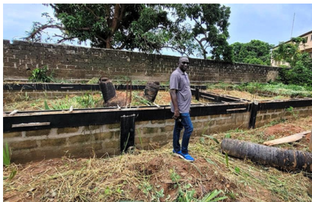
TOF 22-01 Gambia

YMCA Finland og YMCA Gambia har en partnerskabsaftale med fokus på opførelsen af et nyt træningscenter i Banjul. En anmodning om TOF-midler til at støtte oprettelsen af en ny klasseværelsesblok blev fremsat og imødekommet. Mens projektstart blev forsinket på grund af udfordringer med at sikre et lovet byggelån og med at koordinere med den lokale generalsekretær på grund af hans travle tidsplan, Arbejdet med centret er endelig begyndt. De vigtigste resultater omfatter borehulsboring, fundamenteringsarbejde og materialeindkøb. Fremadrettet er det næste mål at styrke samarbejdet, sikre klar kommunikation og fortsætte konstruktionen, ideelt set med støtte af yderligere TOF-midler