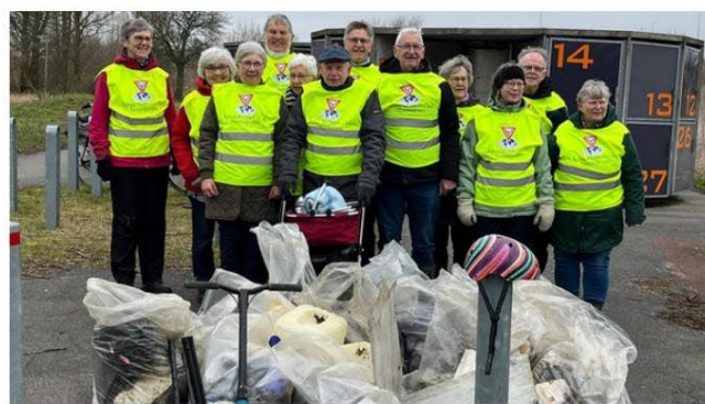
Europa - Y's Men's Club Aarhus, Danmark