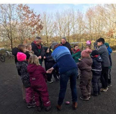
Europa - Y's Men's Club Ringkøbing, Danmark