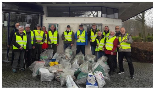
Europa - Y's Men's Club Vejle, Danmark