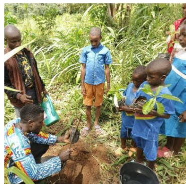
Afrika - Y's Men's Club New Vision Bamenda, Cameroun