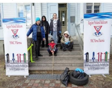
Europa - Y's Men's Club Pärnu, Estland