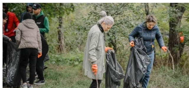
Europa - KFUM Moldova