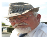
tekst&foto Poul E. Petersen