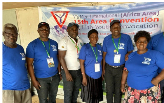
Det 15. Afrika Area konvent og det 11. Ungdomskonvent tema: "Lad dit lys skinne I den mørke verden"