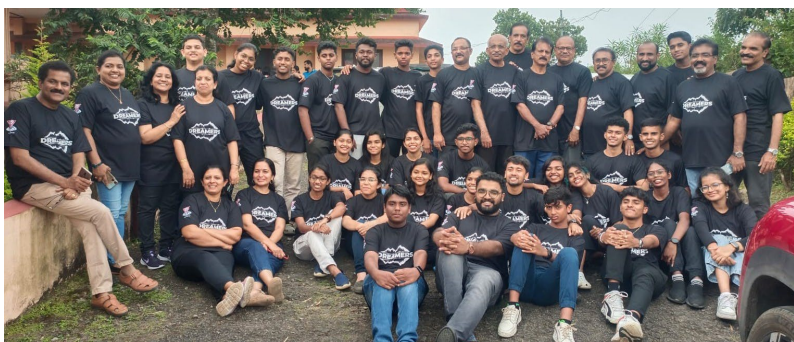
Central Travancore Region Ungdomslejr (Area India)