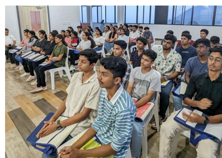
Midt West India Region Ungdomslejr. Tema: "BRB - Breathe, Revel, Belong" (Ånd, svælg, høre til)