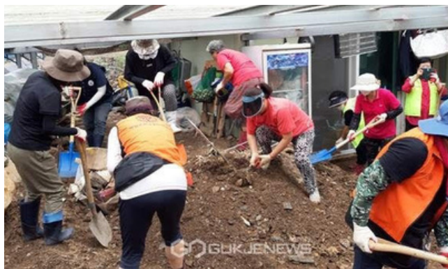
AP Han Il-wook og Y's Men ledere i Area Korea hjalp med oversvømmelsesarbejdet i Sydkorea i sidste måned