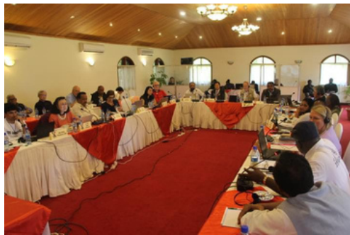
ICM 2023 møde IYR