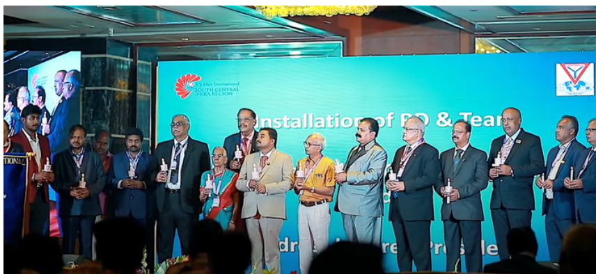
Regional konvent i Central Syd Indien Regionen den 17 June 2023