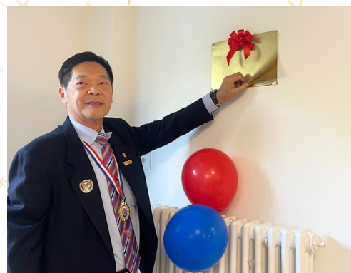
IPE Charming løfter sløret for mindepladen