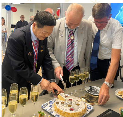
Kagen skæres ud.