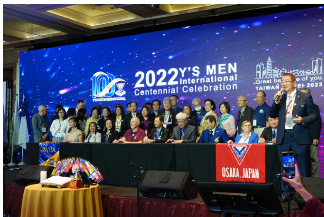
IBC Signing Ceremony between Taipei-Downtown & RAHA Philippines, and Osaka & Toledo-Central at the Centennial Celebration in Taipei, Taiwan in March 2023.